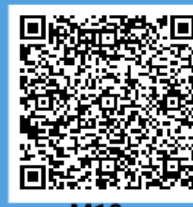
M10 - Lecture Notes English