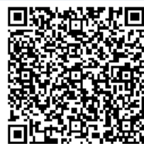
M11 - Synopsis English