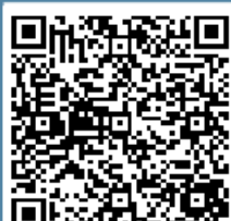
M11 - PowerPoint Italian