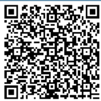
M11 - Lecture Notes English

PROBLEM S VEZOM? KONTAKTIRAJTE NAS. info@swideas.se