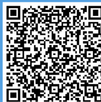
M10 - PPT Italian

PROBLEM S VEZOM? KONTAKTIRAJTE NAS. info@swideas.se